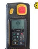
ETUI AVEC CLIP-CEINTURE