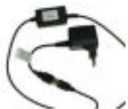
Chargeur Standard ATEX

Attention : la charge en zone ATEX est interdite