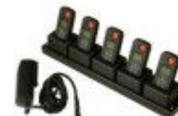
Rack de charge 5 emplacements

Attention : la charge en zone ATEX est interdite